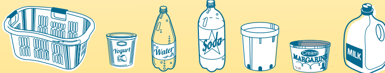
Plastic containers & rigid plastic items Recipientes de plástico y artículos de plástico rígido