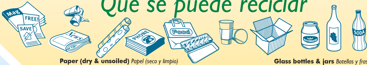
Paper (dry & unsoiled) Papel (seco y limpio)