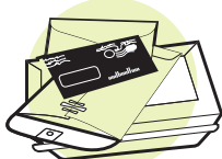
Sobres (con y sin ventana)