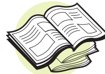
Libros con cubierta suave y catálogos