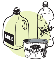
Vacíe los contenedores plásticos