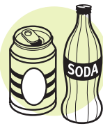
Latas vacías, botellas de vidrio, & frascos