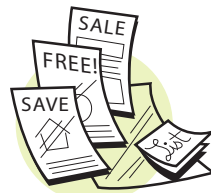
Correspondencia no deseada, papel brillante, y notas adhesivas "post-it notes"