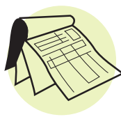
Formas de papel múltiple sin papel carbón