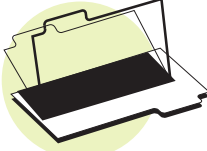
Fólderes para archivar