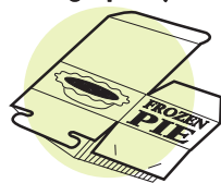
Cartón & envoltura de alimentos congelados