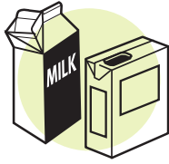
Vacíe los cartones de leche & cartones de jugos