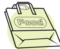
Bolsas de papel