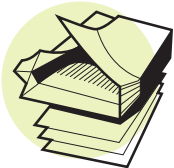
Papel para copiadoras & la envoltura del papel (también papel engrapado)